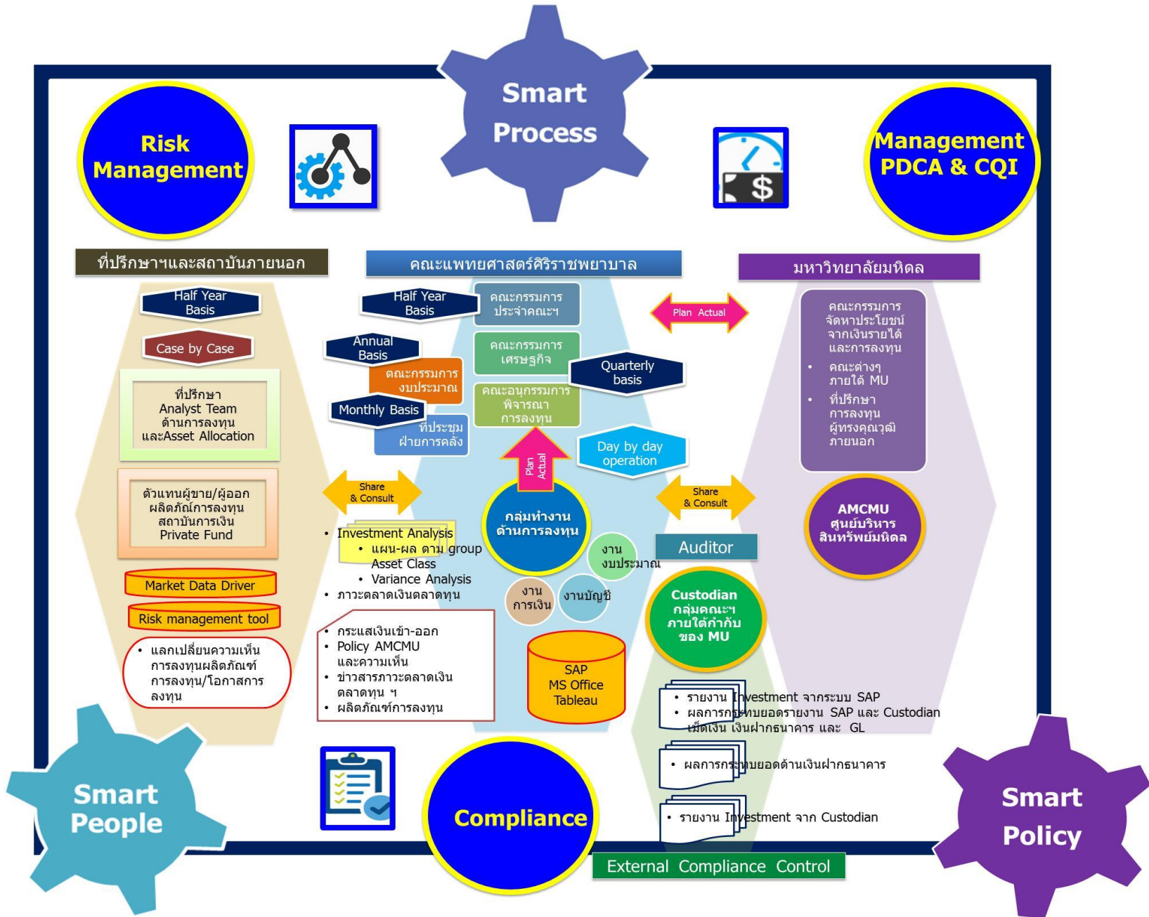
ภาพที่ 2 กระบวนการบริหารเงินลงทุน คณะแพทยศาสตร์ศิริราชพยาบาล