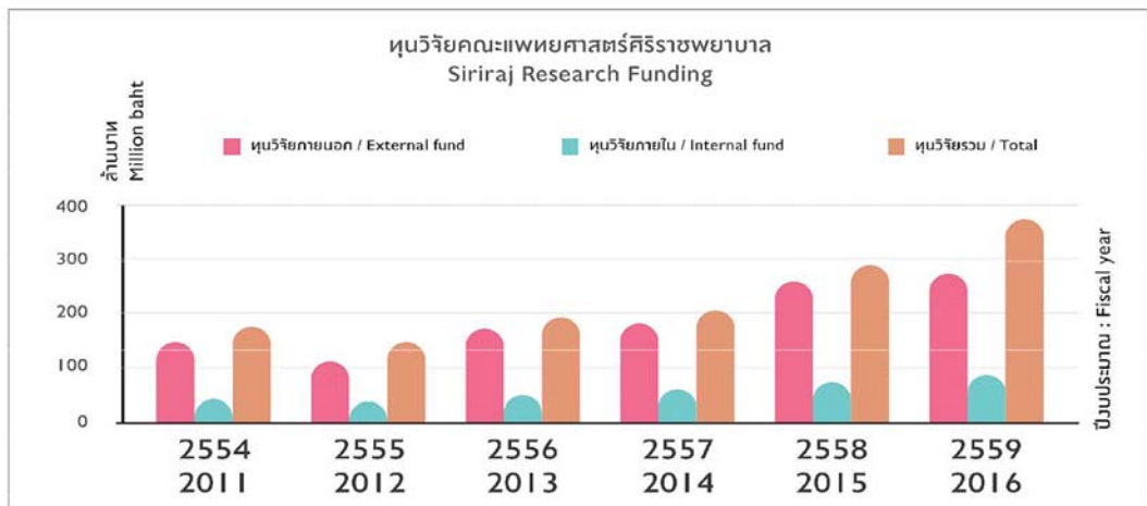
จำนวนเงินสนับสนุนการวิจัย ปีงบประมาณ 2554-2559 Siriraj Research Funding, Fiscal Year 2011-2016

ที่ผ่านมา ทุกโครงการวิจัยมีความคล่องตัวในการบริหารจัดการเอกสารเบิกจ่ายต่างๆและจัดทำรายงานทางการเงินโดยไม่ผ่านระบบคณะฯ แต่หลังจากดำเนินการตามรูปแบบนี้ พบว่าคณะฯ ขาดข้อมูลในการวิเคราะห์ภาพรวมของโครงการวิจัย การจัดเก็บเอกสารเบิกจ่ายต่างๆไม่มีมาตรฐานเดียวกัน อีกทั้งพบปัญหาเรื่องการหักภาษี ณ ที่จ่ายและการนำส่งสรรพากร