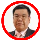
รศ.ดร.ปรีทรรักษ์ พันธุบรรยงก์